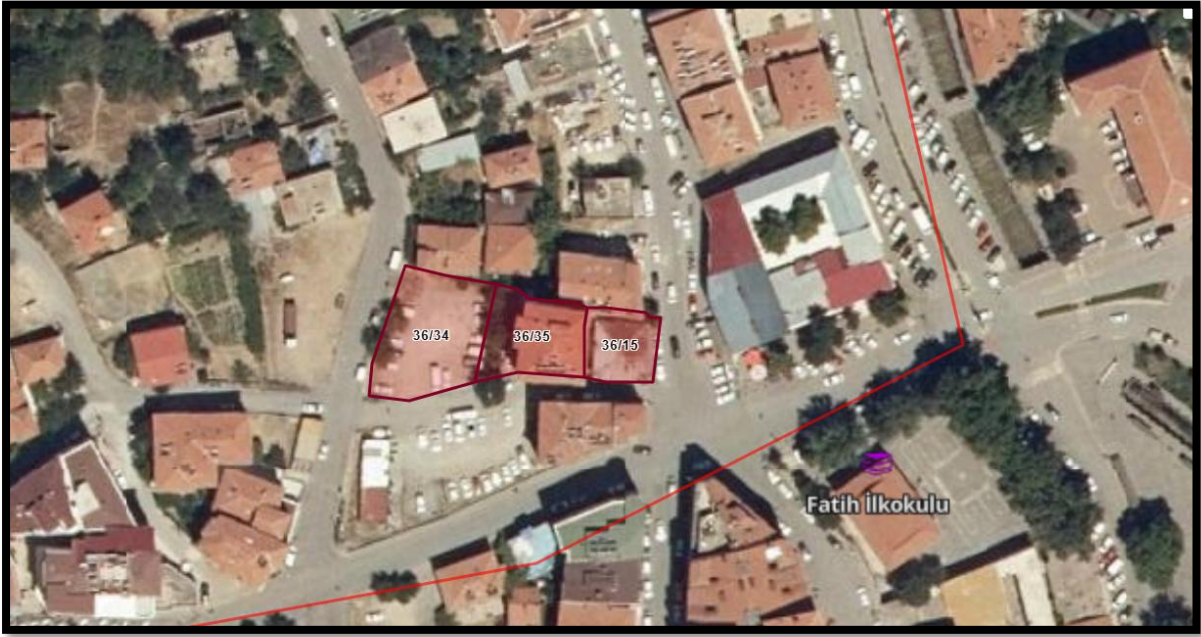
Resim-1: UYDU GÖRÜNTÜSÜ

Planlama alanı, mevcut 1/1000 Ölçekli Uygulama İmar Planında “A4 Nizamlı Yerleşik Konut Alanı” ve “B5-0.80/4.00 Ticaret-Konut Alanı ve 5 m. lik yol ” olarak planlıdır.