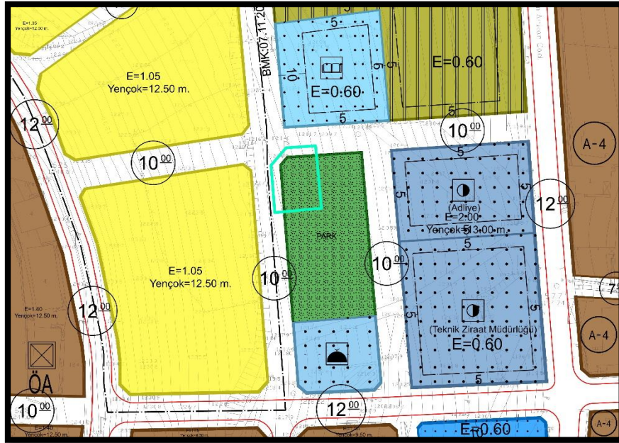
Resim-1: MEVCUT UYGULAMA İMAR PLANI

Hazırlanan Uygulama İmar Planı değişikliği ile 1542 ada 2 parsel numaralı parselin bulunduğu alan park alanı olarak planlı olup Yahyalı Belediyesi yeni yapılacak Trafo alanının Park alanının Kuzey-Batı köşesinde planlanmasını daha uygun gördüğünden bölgenin elektrik ihtiyacının düzenli karşılanabilmesi amacıyla “Trafo Alanı” planlanmıştır.